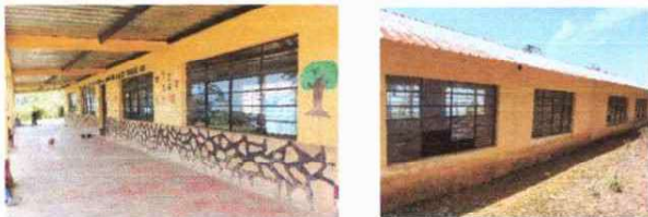
Foto 5: 4) Balcones de enfrente de 3mts largo x 1.50 ancho y 4) Balcones en la parte de atras de 2.40 mts x 1.50 ancho