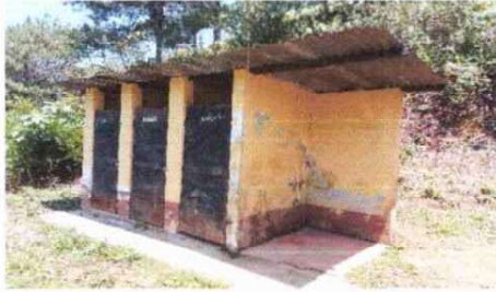
Foto1: Reparación de sanitarios techo laminas reforzar paredes cambio de puertas.