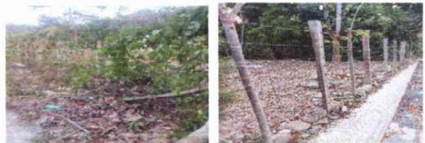
Foto 6: Circulacion Perimetral de Maya de 2metros y tuvos galvanizados de 2mts total de circulacion 250mts cuadrados

Observación: Si es necesario se pueden agregar hojas adicionales y actualizar el número de hojas