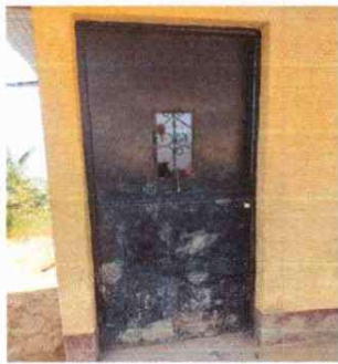
Foto3: Cambio de puerta